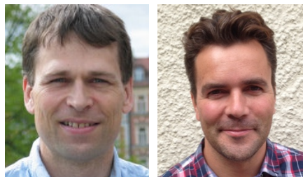
IVL – Svenska Miljöinstitutet