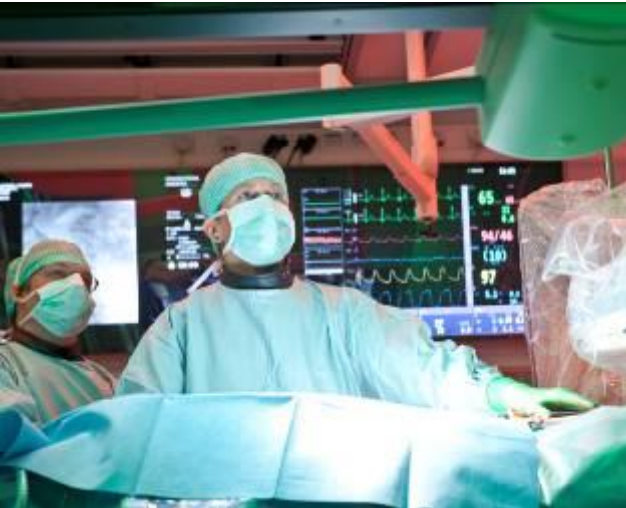
1. Hälsa – och sjukvård