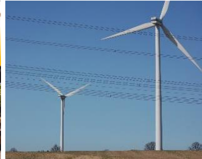
3. Regional utveckling