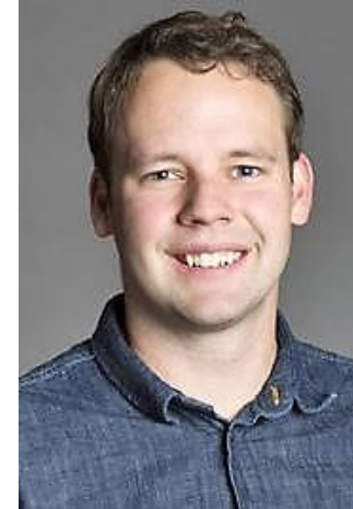
Rickard Nordin Riksdagsledamot (C)